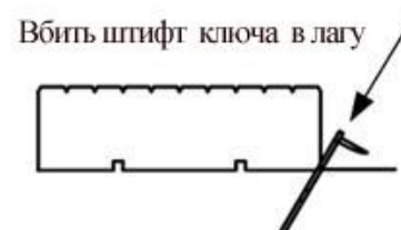
Рис.4 Вбить штифт ключа в лагу