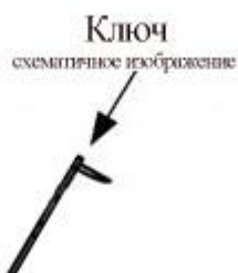
Рис.2 Крепление ключ. Дальнейшее изображение на схемах