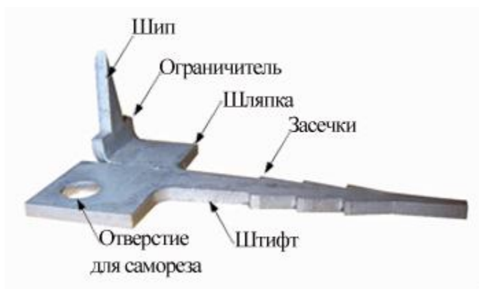
Рис.1 Крепление Ключ (Кляммер). Обозначения