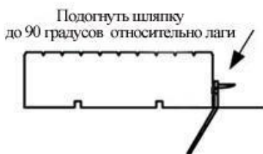
Рис.5 Подогнуть шляпку до 90 градусов относительно лаги