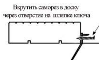
Рис.6 Вкрутить саморез в доску через отверстие в шляпке ключа